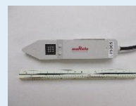
土壌センサ (体積水分率・EC・温度)